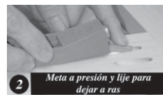
2 Meta a presión y lije para dejar a ras