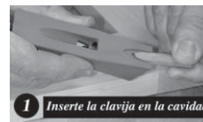
1 Inserte la clavija en la cavidad