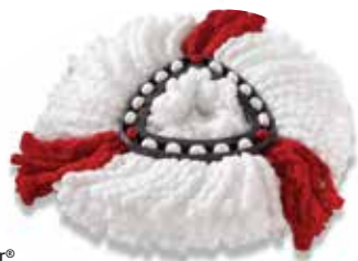
O-Cedar® EasyWring™ Power Refill

Para mejores resultados, cambie los repuestos cada 3 meses