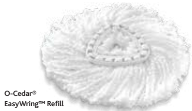
O-Cedar® EasyWring™ Refill