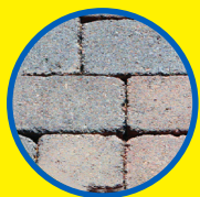
DRIVEWAYS / WALKWAYS