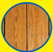
DECKS / FENCES