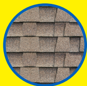
ASPHALT / WOOD / SLATE CLAY / TILE SHINGLES

Elimina manchas provocadas por algas, hongos y moho