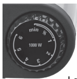
Left control knob Model DB1002B