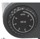
Right control knob Model DB1002B