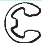
2 "E" Rings 2 Aros en "E" 2 anneaux de retenue "E"