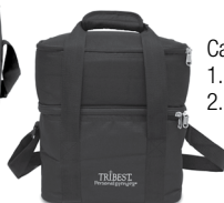
Carrying Cases 1. Black (#PB10BL) 2. Black Deluxe (#PB10BD)