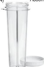
23oz. BPA-Free XL Cup with Lid (#PB02BF)