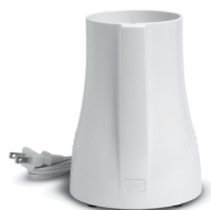
Motor Base (#PB01)

(Please call 888-254-7336 or visit www.tribestlife.com for availability and pricing)