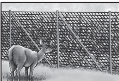
Protect Gardens Proteger jardines