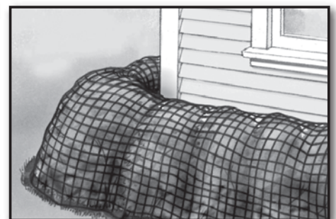
Protect Shrubs Protección de arbustos