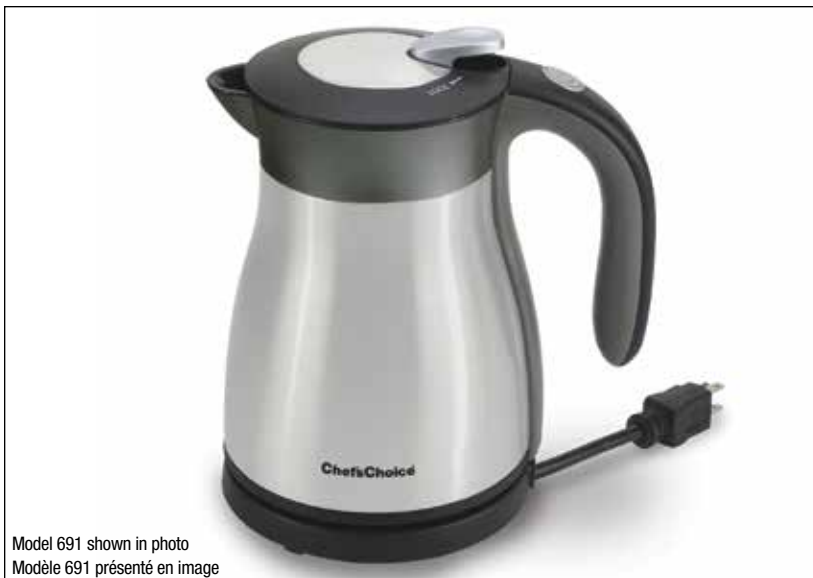
Model 691 shown in photo Modèle 691 présenté en image