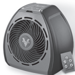
TouchStone™ 500 VORTEX HEATER

Visite www.vornado.com para aprender más o comprar otros productos Vornado de alto rendimiento, incluyendo: Circuladores de aire para toda la sala, Calentadores para toda la sala, Humidificadores, Purificadores de aire y Ventiladores modernos.