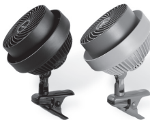
540B & 580HD AIR CIRCULATORS